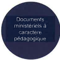
Programme de formation